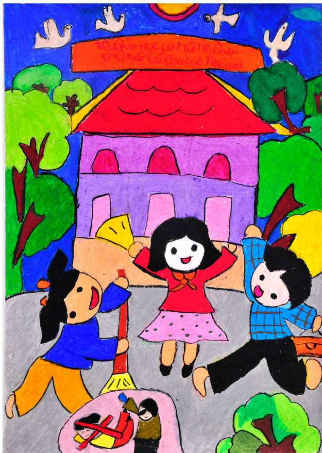
"Trường học là nơi không có bạo lực trẻ em" - Lưu Văn Đức (SN 2005)