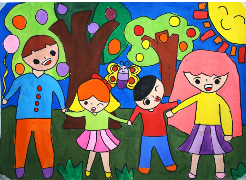
"Trẻ em vui chơi" - Phạm Phương Thảo (SN 2007)