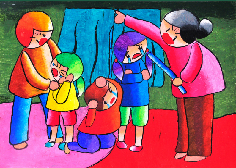
"Xin đừng mắng con" - Vũ Minh Thu (SN 2002)