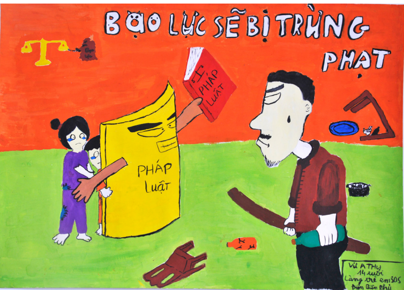
"Bạo lực sẽ bị trừng phạt" - Vừ A Thu (SN 2002)

Không nên bắt trẻ em phải chờ đợi để được bảo vệ khỏi bạo lực. Trẻ cần được bảo vệ ngay bây giờ!