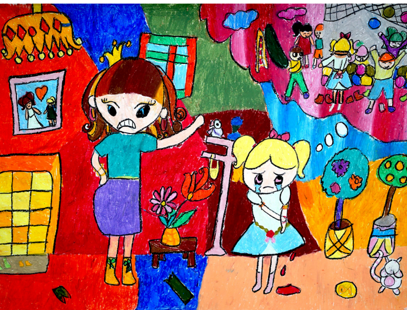
"Mơ ước của em" - Nguyễn Quỳnh Chi (SN 2009)

Người lớn thường đánh trẻ em bởi vì họ chịu nhiều áp lực trong cuộc sống và không biết cách quản lý cảm xúc của mình