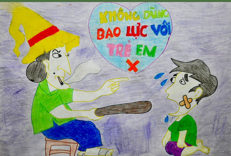
"Đừng đánh con mẹ ơi" - Lý Văn Lộc (SN 1992)

Tất cả các loại hình phạt tàn nhẫn, bao gồm cả thể chất và tinh thần, là sai trái