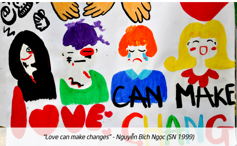
"Love can make changes" - Nguyễn Bích Ngọc (SN 1999)

4 Có rất nhiều điều tồi tệ khác đang xảy ra với trẻ - tại sao chúng ta lại tập trung quá nhiều vào vấn đề trừng phạt thể chất và tinh thần?